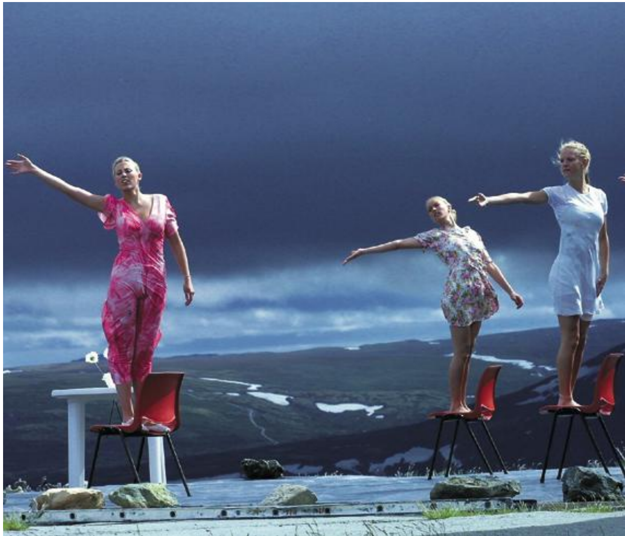
IFRILUFT: 16. juni 2002 danset Lenes dansesenter på Hovden.