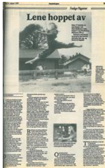
FAKSIMILE Opdalingen 16. august 1991.

forestilling holdt. Skalleberg visste at de måtte synliggjøre hva de holdt på med, men hva skulle de gjøre?