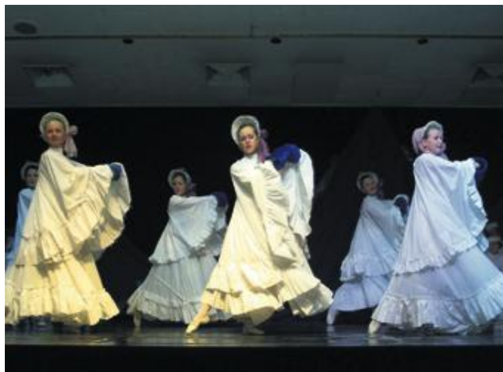
BLÅTTILLYST: Juleforestilling i 2003.