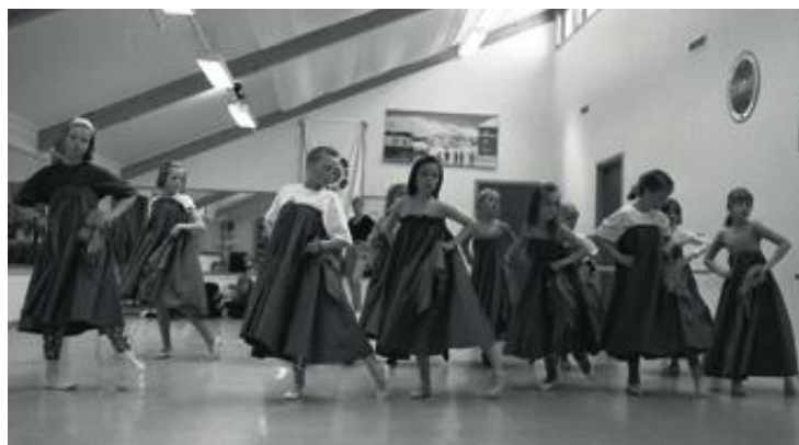
STARTEN: Unge dansere ved Lenes ballettskole i 1991.