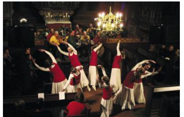
KIRKEDANS: Sammen med Oppdal spell- og dansarlag og Ole Paus i Oppdal kirke.