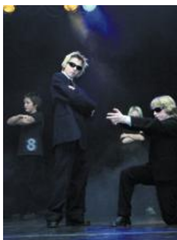
GUTTER I SVART: Fra Man in black.