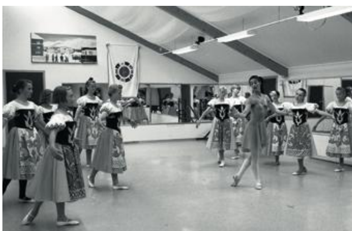
DET FØRSTE BILDET: Fra Opdalingens første besøk på Lenes ballettskole.