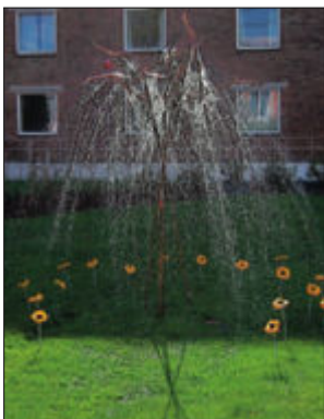
Fontenetreet i Park Hotels bakhage kunne slås av og på av skuelystne.

Den kunne slås av og på av skuelystne, og skal dermed ha blitt et interaktivt og populært kunstinnslag.