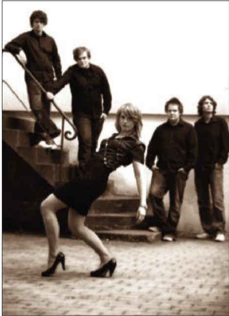
Fra klokken 22, lørdag, inviterer The Benefits til å høre sin nye EP på Draaben.